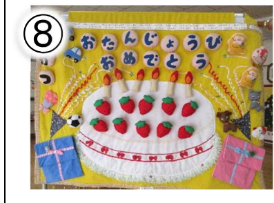
第 34 回修了記念 110×140