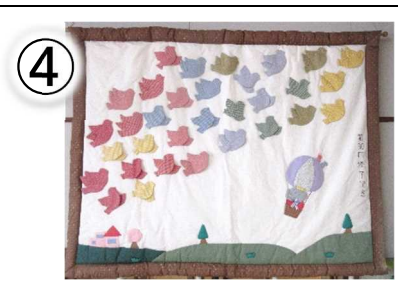
第 30 回修了記念 130×160