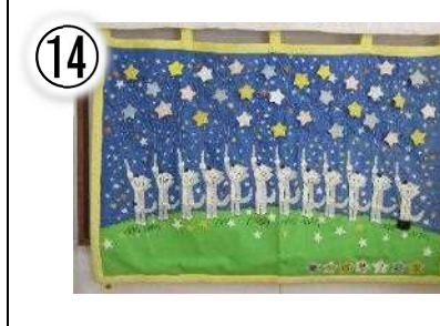
第 40 回修了記念 110×150