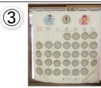
第 25 回修了記念 100×90