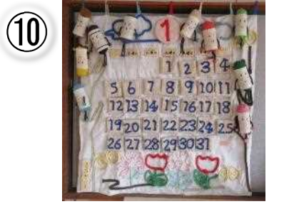
第 36 回修了記念 90×80