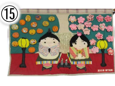
第 41 回修了記念 95×150