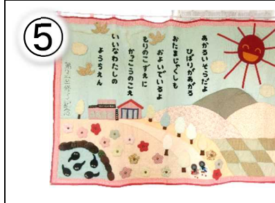
第 31 回修了記念 130×185