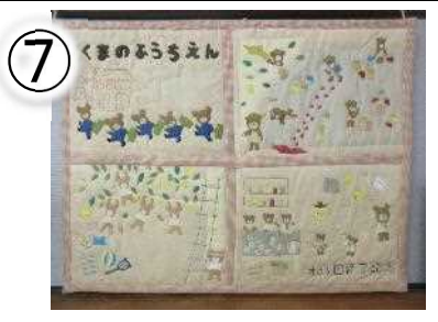
第 33 回修了記念 85×105