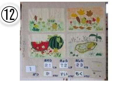
第 38 回修了記念 125×135