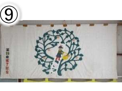
第 35 回修了記念 85×185