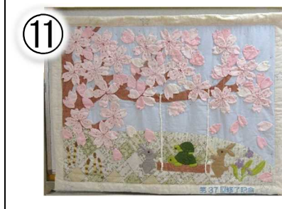
第 37 回修了記念 90×115