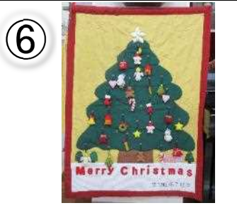
第 32 回修了記念 130×95