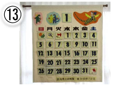
第 39 回修了記念 100×90